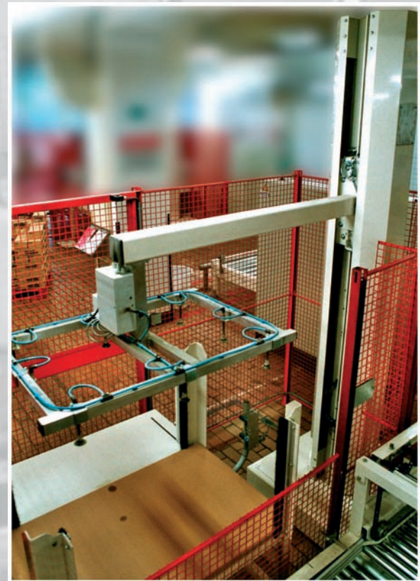
Un dispensador de hojas