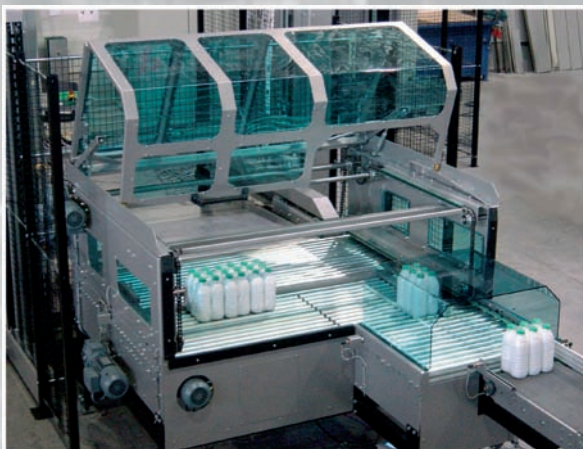
Modulo de formación de capas del Lowrunner

NEDPACK está especializado en la fabricación de módulos funcionales como los componentes principales de la maquinaria de paletizado. Muchos años de experiencia en el manipulado de productos de alta rotación nos ha llevado a desarrollar diferentes módulos funcionales estándar. Crear su propio paletizador a medida, es tan simple como escoger los módulos funcionales adecuados a sus necesidades, en lugar de realizar arriesgados prototipos con los peligros que conlleva siempre la formula de ensayo y error. Una estandarización a través de toda la gama de módulos funcionales garantiza la compatibilidad en futuras ampliaciones.