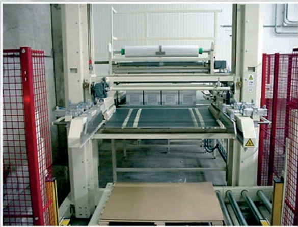
Un Lowrunner con dispensador de film incorporado